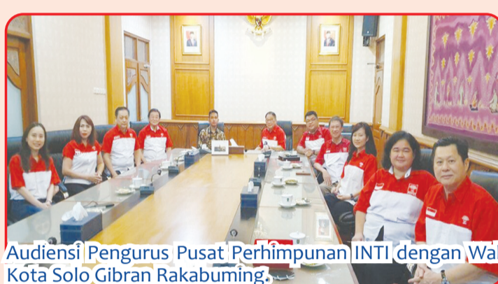
Audiensi Pengurus Pusat Perhimpunan INTI dengan Wali Kota Solo Gibran Rakabuming.

Sementara sebelumnya, Menteri Bahilil menjamin kemudahan investasi yang ada di Indonesia. "Kalau ditanya tadi, apa jaminan pemerintah untuk masuknya investasi. Kalau dulu susah izin, saya akan jamin perizinan mudah.