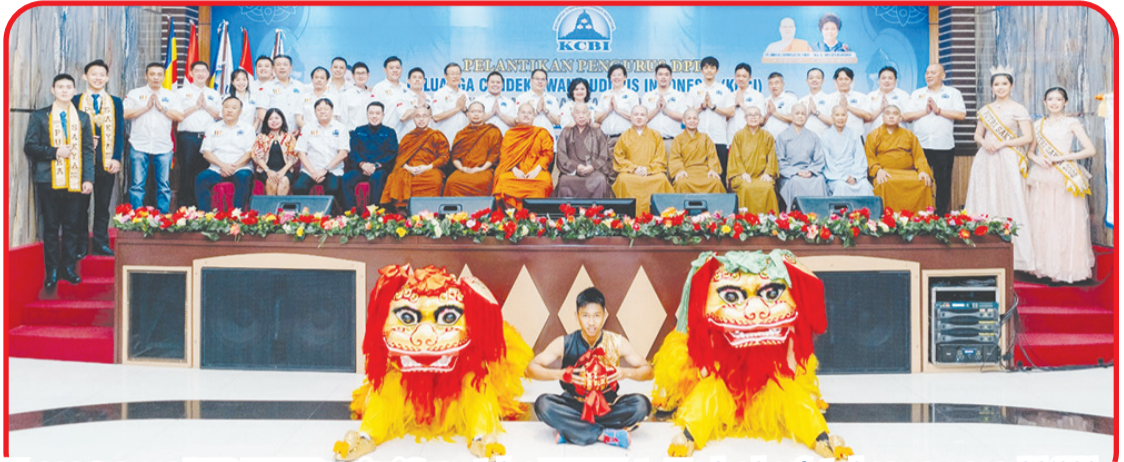
Kepengurusan DPD KCBI Provinsi Sumut dan KCBI Kota Medan berfoto bersama para bhikkhu dan pengurus DPP KCBI dan tokoh.