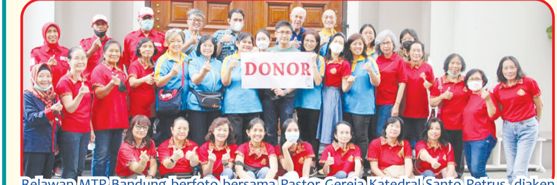
Relawan MTP Bandung berfoto bersama Pastor, Gereja Katedral Santo Petrus, diaken dan relawan.