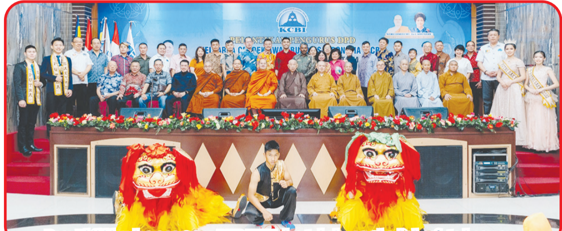
Para Bhikkhu dan pengurus DPP KCBI dan tokoh yang hadir berfoto bersama.

MEDAN (IM) - Kepengurusan DPD KCBI (Keluarga Cendekiawan Buddhis Indonesia) Provinsi Sumatera Utara dan DPD KCBI Kota Medan, Sabtu (18/3) lalu resmi dilantik.