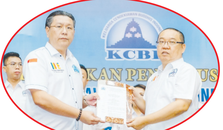
Penyerahan surat keputusan kepengurusan KCBI Kota Medan.