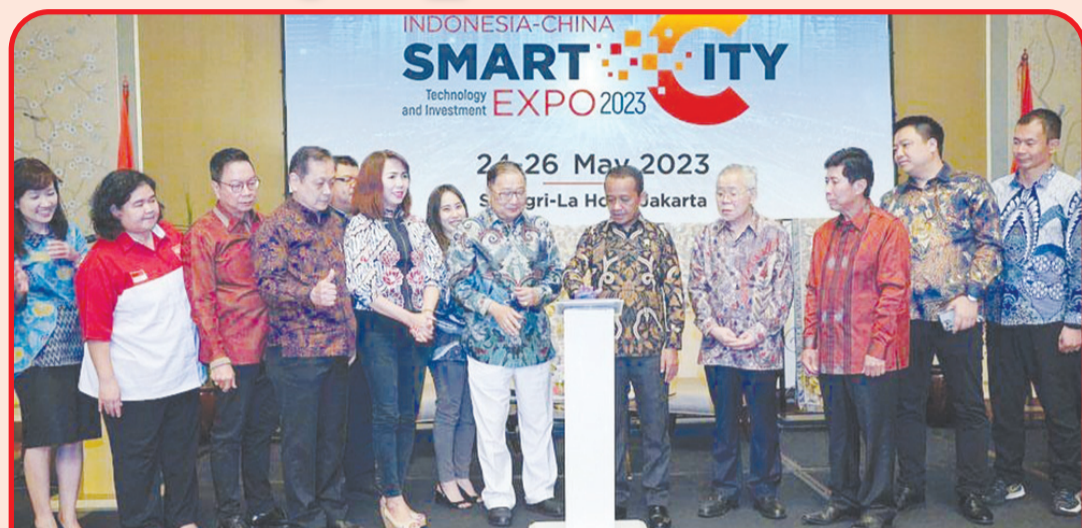
Menteri Investasi/Kepala BKPM | Bahilil Lahadalia disaksikan Ketua Umum INTI | Teddy Sugianto dan jajaran pengurus INTI, menekan tombol sirene peluncuran Indonesia-China Smart City Expo 2023.