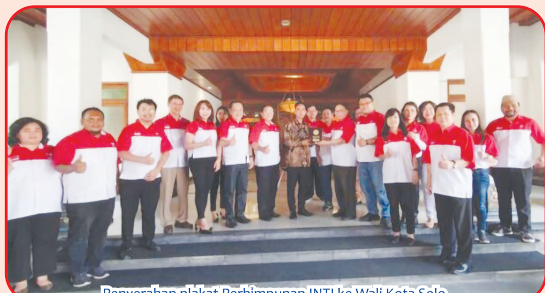
Penyerahan plakat Perhimpunan INTI ke Wali Kota Solo.

JAKARTA (IM) - Perhimpunan INTI (Indonesia Tionghoa) mengajak Menteri Investasi/Kepala BKPM (Badan Kordinasi Penanaman Modal) Bahilil Lahadalia melakukan peluncuran acara "Indonesia-China Smart City Expo 2023" pada Kamis (16/3) sore di Hotel Shangri-La, Jakarta.