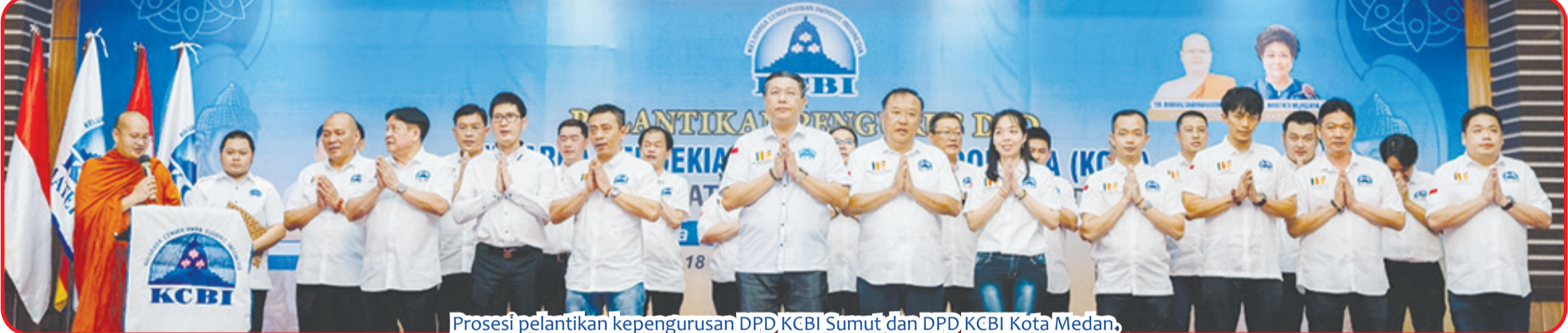
Prosesi pelantikan kepengurusan DPD KCBI Sumut dan DPD KCBI Kota Medan.

KCBI memandang perlu umat Buddha yang berpendidikan tinggi, berwatak intelektual, berprestasi di masyarakat memiliki rasa persatuan dalam rangka membantu mereka yang masih tertinggal, agar bersama-sama bisa turut mengabdikan dan berbakti pada Agama, Nusa dan Bangsa berdasarkan Pancasila, Bhinneka Tunggal Ika, UUD Negara Republik Indonesia tahun 1945 dan NKRI (Negara Kesatuan Republik Indonesia). • Kris