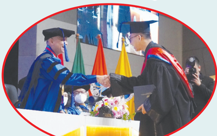
Rektor memberi ucapan selamat ke wisudawan.

SURABAYA (IM) - PCU (Petra Christian University) me-wisuda 516 orang lulusan, dalam acara wisuda ke-83, digelar di Auditorium kampus Timur Ge-